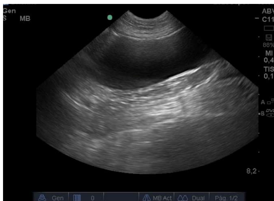
Figura 5. Perra hembra, Alaskan Malamute, nulípara, de 15 meses, presentada a consulta por secreción vaginal purulenta y decaimiento general. Siete días después del ingreso a la clínica y posterior al lavado uterino vía endoscópica, en la ecografía abdominal se observa vejiga plétórica y ausencia de estructuras circulares pequeñas con contenido anecoico en el lumen del útero