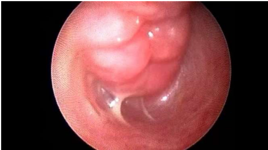
Figura 2. Perra hembra, Alaskan Malamute, nulípara, de 15 meses, presentada a consulta por secreción vaginal purulenta y decaimiento general. Vaginoscopia con visualización de porción vaginal del cérvix y secreción mucopurulenta en el fórnix