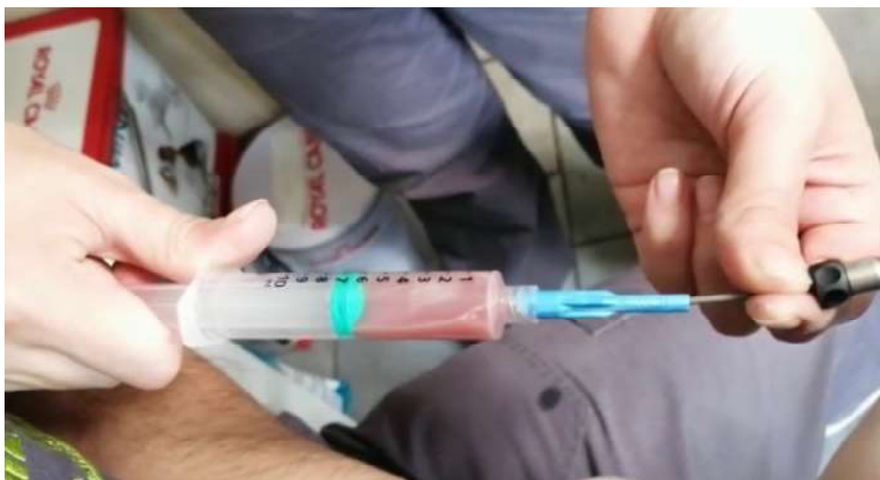
Figura 3. Perra hembra, Alaskan Malamute, nulípara, de 15 meses, presentada a consulta por secreción vaginal purulenta y decaimiento general. Lavado uterino, vía endoscópica, con obtención de material mucopurulento desde la luz uterina

Al considerar el antecedente anamnésico, que indicaba que el cuadro con secreción vaginal purulenta se presentó dos a tres semanas posteriores al estro, se pudo inferir que la paciente se encontraba en el diestro del ciclo estral canino (Sánchez, 1999); momento en que las infecciones endometriales se describen como altamente prevalentes,