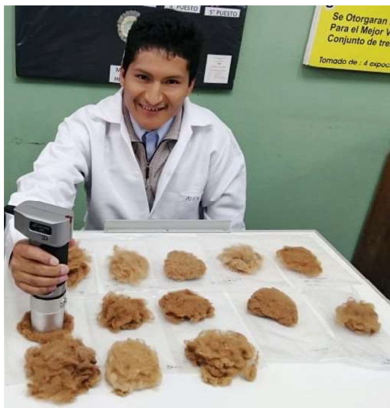
Figura 2. Fibra de vicuña descordada ( down ) y lavada