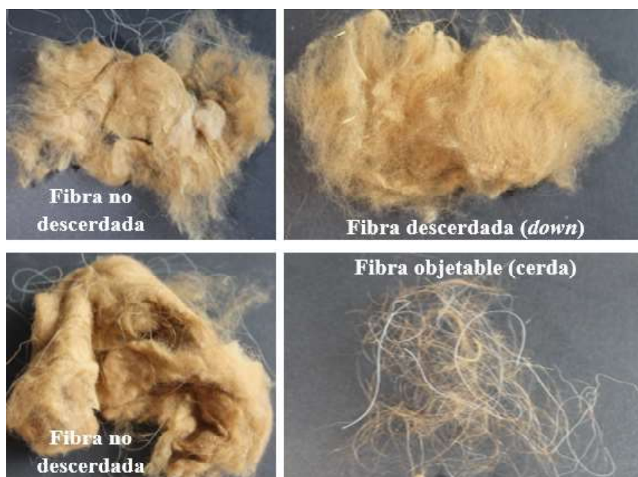
Figura 1. Descerdado manual de la fibra de vicuña