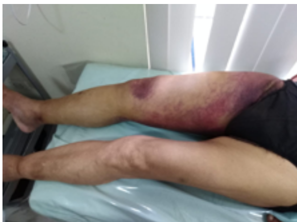
Figura 3. Caso 3. Cianosis de muslo con edema de muslo y pierna.