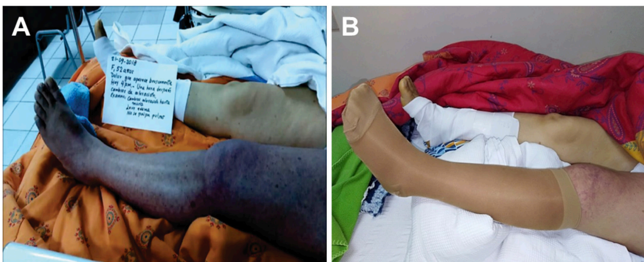
Figura 1. Caso 1. A: cianosis severa y edema al ingreso. B: tres días después, sin cianosis, edema resuelto y con medias de compresión.

Al quinto día de ingreso presentó cianosis de mano derecha (figura 2A); ante la sospecha de trombosis arterial le realizaron eco Doppler arterial, no se encontró obstrucción. Se realizó eco Doppler venoso y se diagnosticó trombosis venosa. Recibió enoxaparina, siendo la evolución desfavorable; presentó necrosis de dedos y gangrena venosa al décimo cuarto día de internamiento (figura 2B). Se realizó amputación selectiva. La evolución fue favorable, siendo dada de alta luego de 38 días de hospitalización.