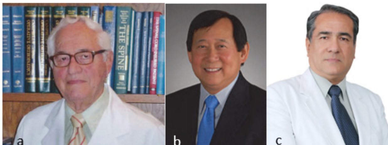
(a) P. Kambin desarrolló la discectomía percutánea. (b) A. Yeung y el desarrollo de la discectomía endoscópica transforaminal (1999). (c) Wesley Alaba en 2011 inició la era de la neuroendoscopia espinal en el Perú.