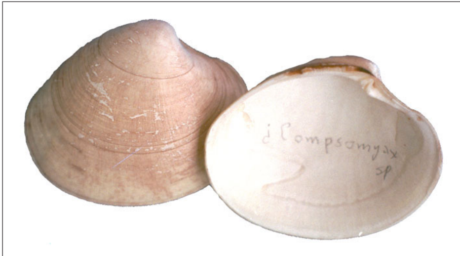
Figura 5. Eurhomalea lenticularis , longitud 42,8 mm

SUBCLASE ANOMALODESMATA ORDEN SEPTIBRANCHIDA FAMILIA CUSPIDARIIDAE DALL, 1886