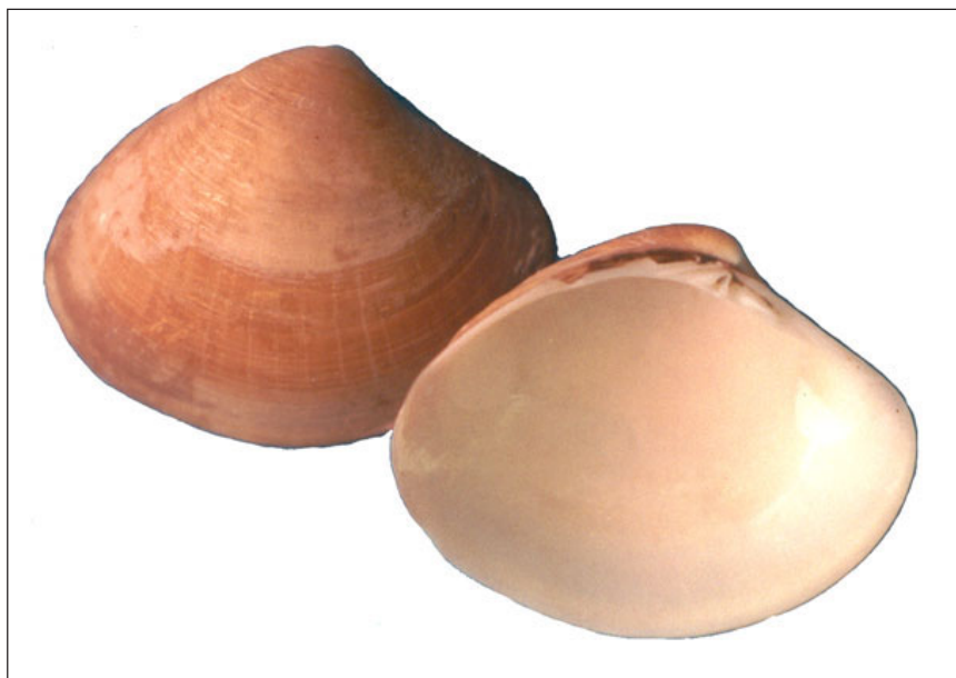
Figura 4. Pitar (Pitar) helenae , longitud 32,5 mm.

minentes en los extremos; exterior crema claro con bandas anchas pardas y con manchas angulares más oscuras; margen de las valvas liso; interior blanco amarillento con la cavidad umbonal púrpura pálido. Longitud 32,5 mm.