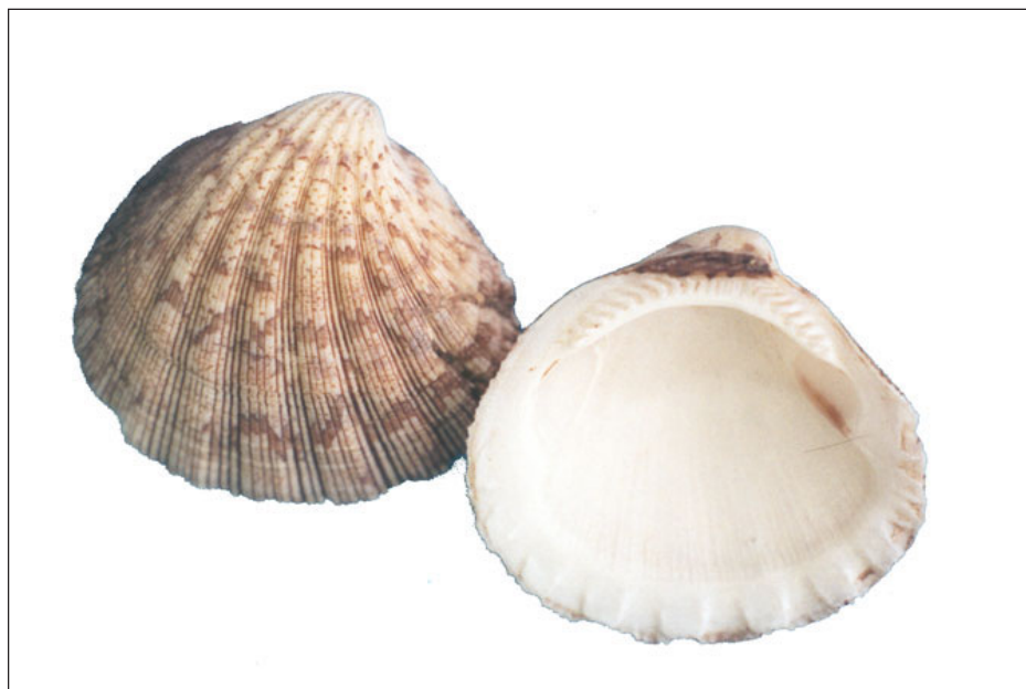
Figura 1. Glycymeris (Axinactis) delessertii , longitud 40,5 mm.

1943: 153; Bernard, 1983: 17; Keen, 1971: 55, fig. 113; Skoglund, 1991: 9.