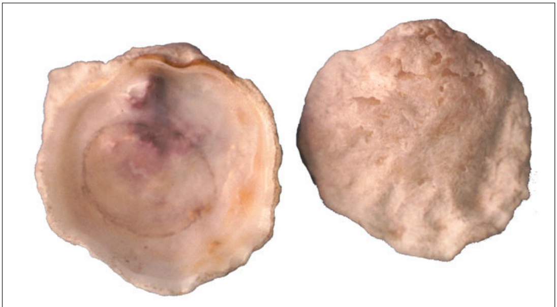
Figura 3. Parahyotissa (Pliohyotissa) quercinus , longitud 21,0 mm.

Concha triangular inflada con umbo prominente y los extremos redondeados, siendo el anterior más estrecho; lúnula grande y alargada; escultura con estrías concéntricas más pro-