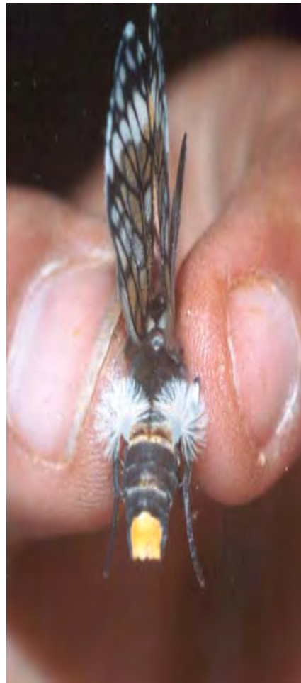
Figura 2 . Penachos de pelos dorsales de Theages griseatum Walker, en espécimen vivo.

Al realizar la preparación y el retiro de las escamas de los terga abdominales de especímenes machos de Theages griseatum (Rothschild), se observa que en las áreas ánterolaterales de los segmentos IV, V, VI y VII, hay un conjunto de cerdas, que se disponen con dirección hacia el margen mesal, en una invaginación del margen anterior del mismo segmento y que están cubiertos por el segmento abdominal anterior (Fig. 3). La disposición telescópica de los segmentos, hace que