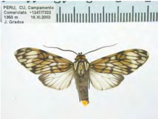
Figura 1 . Theages griseatum Walker, macho

paró láminas con bálsamo de Cánada. Los dibujos se realizaron con cámara lúcida.