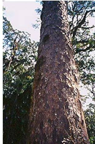
Figura 4. Nageia rospigliosii (Pilger) Laubenfels.

= P. macrostachyas Parl. in DC. Prod. 16. II. 510. (1868).