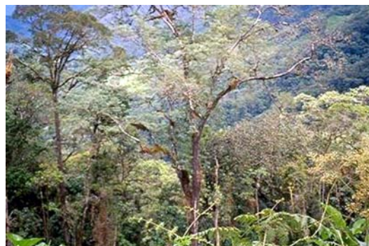
Figura 3. Bosque de La Bermeja en San Ignacio, Cajamarca.

Tropical (bp-MBT). Se trata de una zona de reciente colonización, debido al difícil acceso; por ello aún se pueden observar grandes extensiones de bosque virgen. Debido a su fisiografía tiene muy poco terreno con aptitud agrícola, pese a esto los pobladores establecen cultivos de café, yuca, plátano, con pocos resultados, sólo les alcanza para sus necesidades básicas, la mayor parte de los campesinos establecen pastizales o «invernadas».