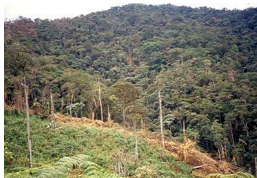
Figura 2. Bosque de Selva Andina en San Ignacio, Cajamarca.

Nuevo Mundo-Piragua (distrito de Huarango): situado a 1550 m ( 05^{\circ}14'93'' S y 78^{\circ}38'42'' W) representa bosque pluvial Montano Bajo