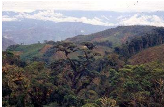
Figura 5. Prumnopitys harmsiana (Pilger) Laubenfels.

= Podocarpus oleifolius var. macrostachyus var. (Parl.) Buchholz & N.E. Gray, Journ. Arnold Arb. 29: 140. 1948.