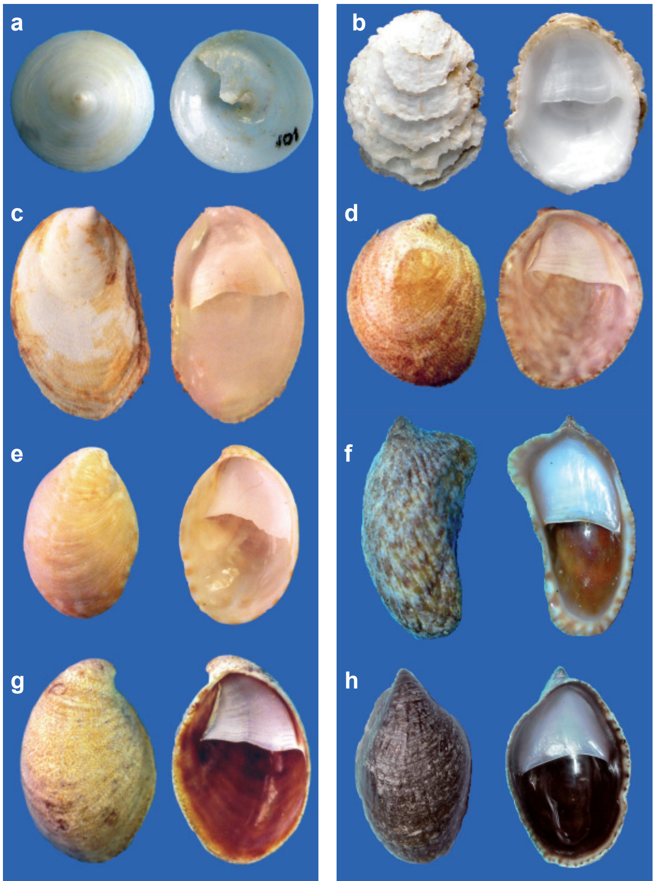
Figura 1. (a) Calyptraea mamilaris , diámetro 26,8 mm; (b) Crepidula (J.) lessonii , longitud 28,3 mm; (c) Crepidula (J.) nivea , longitud 20,8 mm; (d) Crepidula (J.) striolata , longitud 38,7 mm; (e) Crepidula excavata , longitud 39,6 mm; (f) Crepidula incurva , longitud 28,4 mm; (g) Crepidula onyx , longitud 9,9 mm; (h) Crepidula rostrata , longitud 12,5 mm.