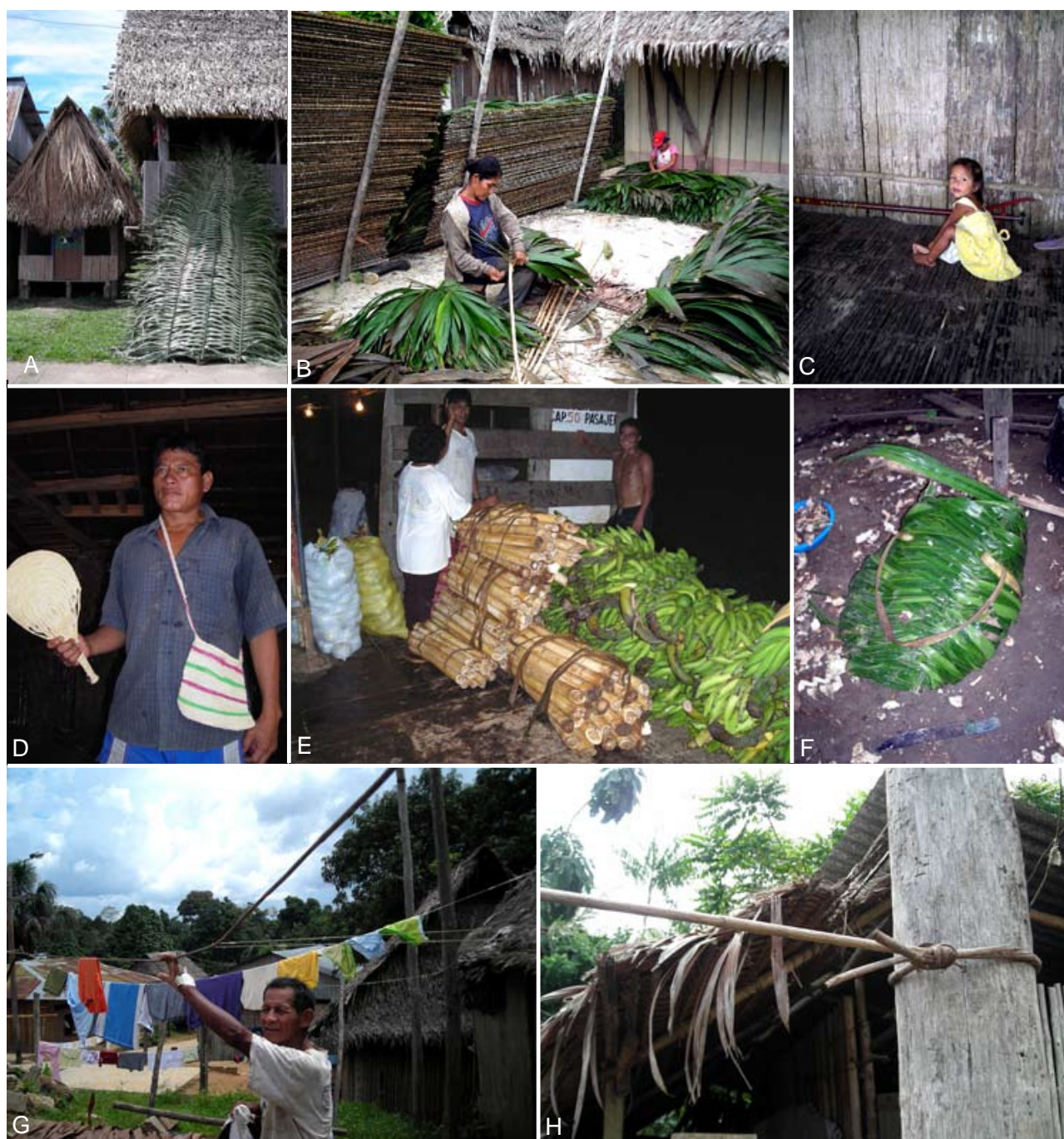
Figura 2. Usos de palmeras, en los alrededores de Iquitos, Amazonía Peruana. A. Techos de Mauritia flexuosa (vivienda pequeña lado izquierdo) y de Attalea phalerata (vivienda grande lado derecho), y cumbres aún no colocadas (hojas verdes de Attalea phalerata apoyadas). B. Hojas de Lepidocaryum tenue , tejidos para la construcción de los techos. C. Interior de vivienda rústica con pisos y paredes utilizando madera de Socratea exorrhiza . D. Abanico tejido de hojas de Astrocaryum chambira . E. Palmitos de Euterpe precatoria siendo transportado a los mercados en Iquitos. F. Canasto tejido de hojas de Aphandra natalia . G-H. Tallo de Desmoncus giganteus usado como cuerda.

la hepatitis, náusea y vómito. Construcción — Los troncos son utilizados para obtener tablas que son usadas en los pisos y las paredes de las viviendas, y como vigas en la construcción de techos; ocasionalmente también son usados como postes en la construcción de viviendas y cercos; las hojas son ocasionalmente utilizadas en el techado de viviendas temporales y viviendas chicas. Herramientas y utensilios — Ocasionalmente las raíces fúlcreas cubiertas de espinas son utilizadas para rallar plátano o pelar yuca; las semillas se utilizan para collares. Alimenticio — Los frutos suelen ser utilizados para la elaboración de bebidas y se comen; las larvas de coleóptero que se desarrollan en los