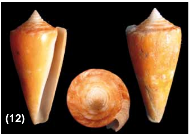
Figuras 9 – 13. (9) Conus (Ximeniconus) perplexus ; (10) Conus (Ximeniconus) tornatus ; (11) Conus (Ximeniconus) ximenes ; (12) Conus kohni ; (13) Conus xanthicus .

Hábitat: Sublitoral arenoso. Entre 61 y 109 m de profundidad (Hendrickx & Toledano 1994).