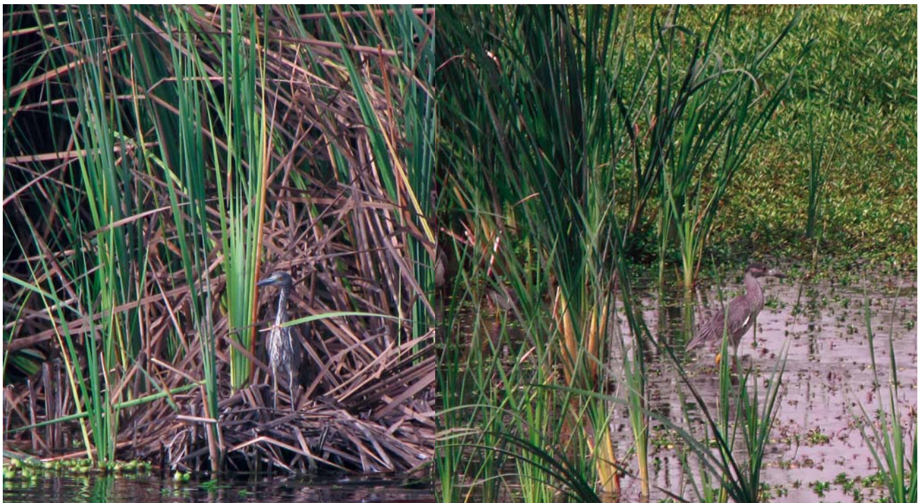
Figura 2. Nyctanassa violacea en la Laguna de Puchún, Camaná, Arequipa, febrero de 2010, individuos juvenil (izquierda) y adulto (derecha).

Es importante, que para definir nuevas poblaciones residentes en otros humedales de la costa peruana, se confirme nidificación y presencia de juveniles; ya que en los individuos adultos la observación de plumas “ornamentales” en la cabeza, no es un indicador de estado reproductivo, debido a que éstas se presentan desde la primera muda prebásica y no como generalmente se piensa en una muda pre alterna o de “plumaje reproductivo”, inexistente en esta especie (Pyle & Howell 2004), de manera tal que no es indicador de reproducción activa en el lugar.