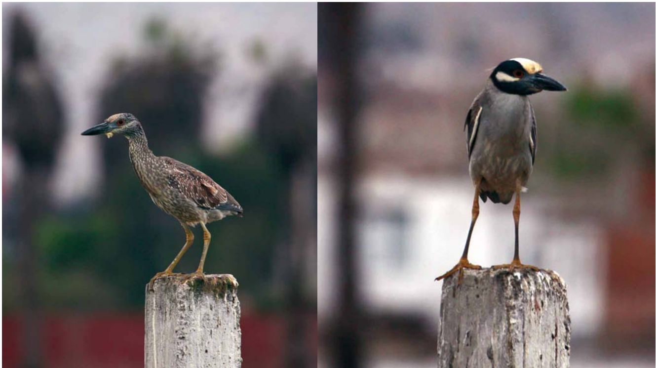
Figura 1. Nyctanassa violacea en el Refugio de Vida Silvestre Pantanos de Villa, julio de 2008, individuos juvenil (izquierda) y adulto (derecha).

esté dispersándose y colonizando otros humedales costeros, al aumentar la competencia por recursos con sus congéneres.