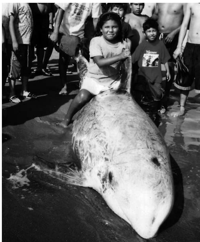
Figura 3. Varamiento de Grampus griseus en Vila-vila, Tacna, en febrero de 2005.