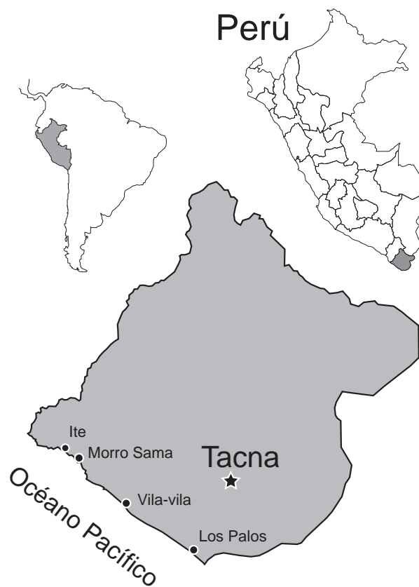
Figura 1. Ubicación de las localidades de observación de varamientos de cetáceos entre el año 2002 y 2010.

en playas de Los Palos, mientras que los varamientos de pequeños cetáceos se observaron en diferentes localidades (Tablas 1 y 2).