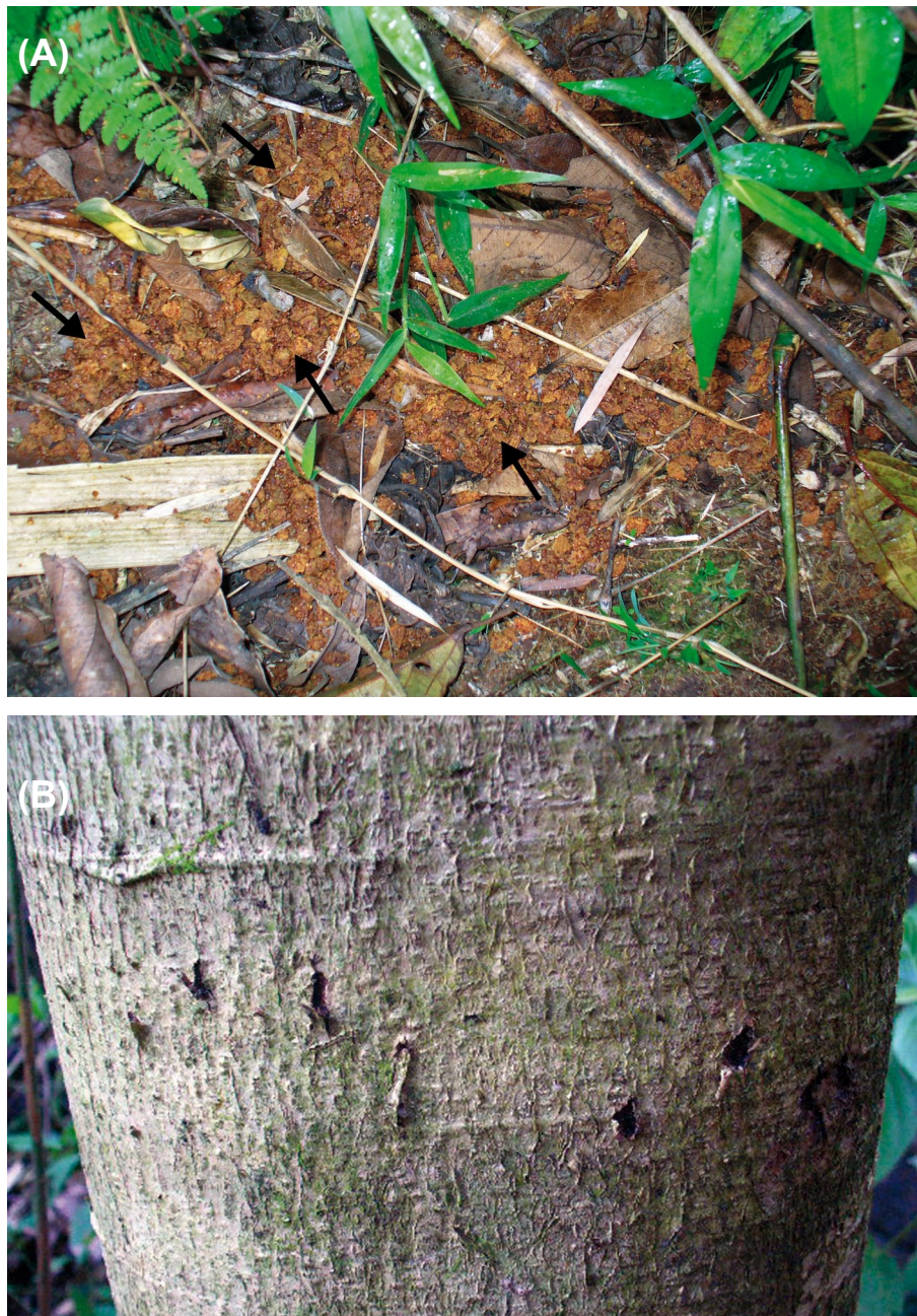
Figura 2. (A) Heces dispersas del oso andino con semillas perteneciente a la familia Lauraceae (flechas), a aproximadamente 2000 msnm, en el bosque montano de Yanacocha. (B) Marcas de garras del oso andino sobre un árbol de aproximadamente 20 m de altura, a unos 1265 m de altitud en el bosque premontano de Challohuma.

por uso humano. Para que de este modo sea posible conocer los factores clave que podrían afectar a los osos y así aproximarnos a determinar su viabilidad a largo plazo en la región. También se sugiere la extensión de la zona sur de la ZA del PNBS hasta los bosques montanos de Yanacocha, ya que la ZA de este parque nacional protege una muy pequeña porción de estos bosque tropicales de altura (Ministerio de Agricultura 2003), los cuales albergan un número alto de especies endémicas y son tan o más diversos que la selva baja (Pacheco 2002, Pacheco et al. 2009).