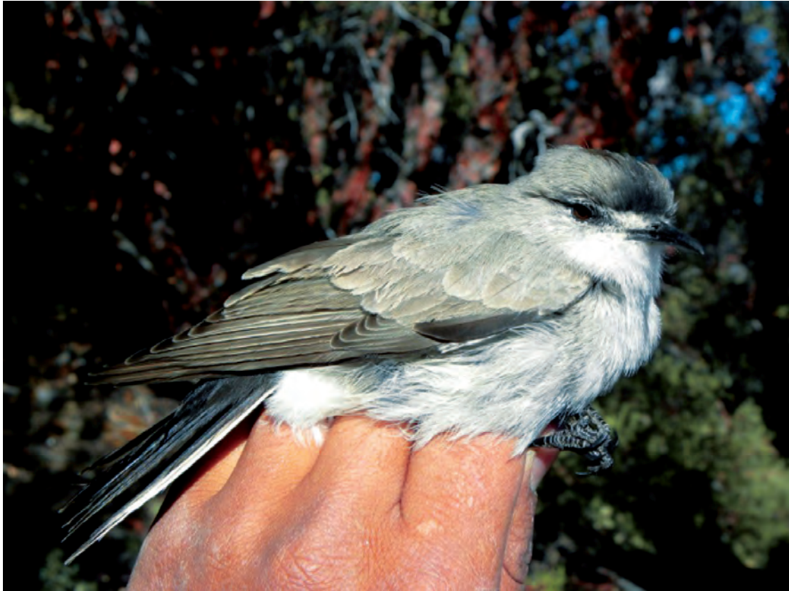
Figura 2. Muscisaxicola frontalis , nótese la coloración negra en la región frontal que se prolonga hasta la región pileal central (corona) y la región loreal de color blanco.

un porcentaje de osificación del cráneo del 25%. Una posterior revisión de la literatura y comparación con especímenes de las colecciones ornitológicas de los Museos de Historia Natural de la Universidad Nacional de San Agustín de Arequipa (MUSA) y de la Universidad Nacional Mayor de San Marcos (MUSM) nos permitieron confirmar que se trata de la especie M. frontalis . El espécimen (junto con el contenido estomacal y tejidos preservados) se encuentra depositado en la colección del MUSM (GSV 2010-85). Con este reporte extendemos el rango migratorio de distribución norte de la especie hasta Huancavelica y su rango altitudinal hasta los 4450 m para el Perú.