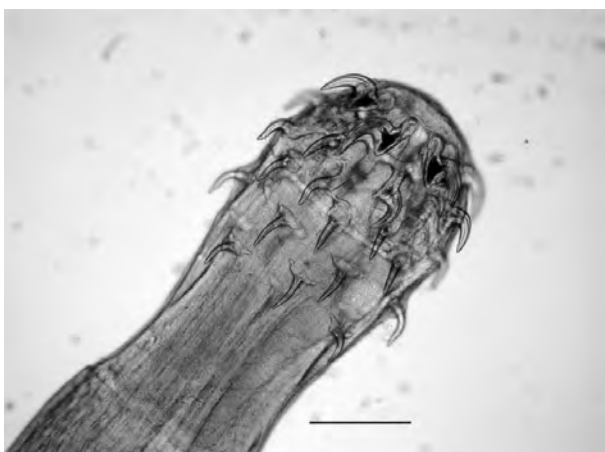
Figura 1. Oligacanthorhynchus carinii . Proboscis de un espécimen adulto. Escala 0,2 mm

Esta especie ha sido descrita en mamíferos dasipódidos (Dasyopidae): Dasyus novemcinctus de Brasil (Travassos, 1917; Lent y Freitas, 1938); en Tolypeutus tricinctus conurus de Bolivia (Meyer, 1933); en Chaetophractus vellerosus y Tolypeutus mataco procedentes de Argentina (Martínez, 1984) y en Tolypeutes mata-