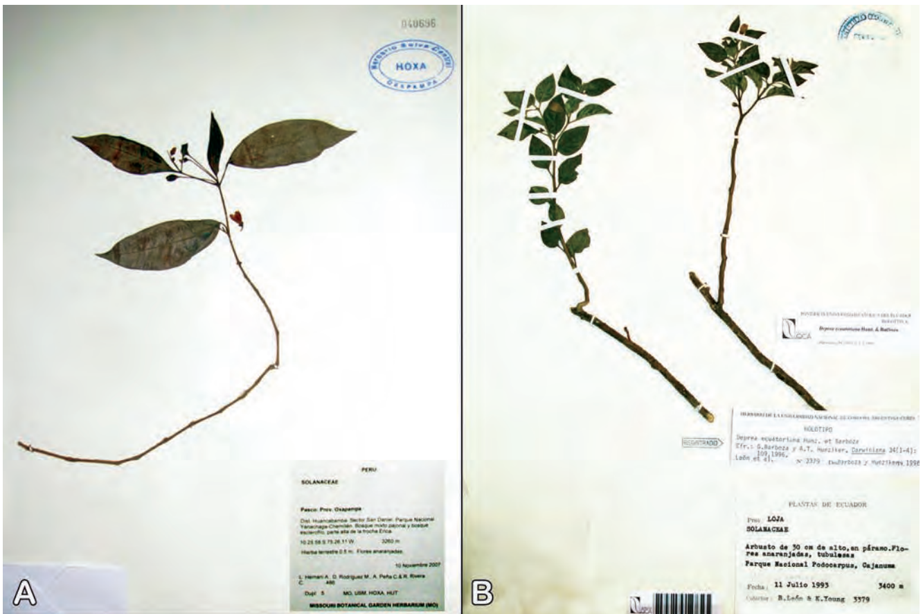
Figura 3. A. Tipo de Deprea oxapampensis M. Cueva & I. Treviño, L.Hernani et al. 486 (HOXA); B. Holotipo de Deprea ecuatoriana Hunz. & Barboza, León & Young 3379 (QCA).