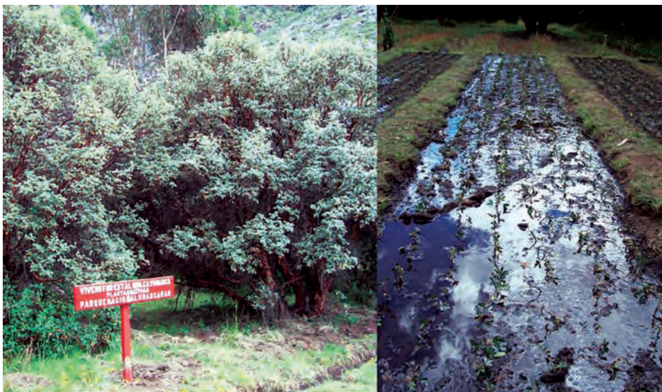
Figura 4. (A) Vivero forestal en la región de El Quilcayhuanca, Parque Nacional Huascarán, donde P. sericea y P. weberbaueri se cultivan para regenerar otros bosques de la región. (B) Parcelas de Polylepis plántulas.