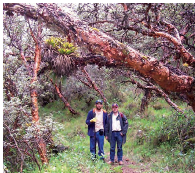
Figura 1. Mezcla de bosques de Polylepis en el Parque Nacional Huascarán, Cordillera Blanca del Perú, que soporta una variedad de epifitas y es importante para la intercepción de neblina.

Todas las especies de Polylepis son arbustos o árboles, algunos hasta 10 m de altura y comparten características morfológicas, que incluyen troncos rojos y torcidos, corteza delgada y exfoliante, y pequeñas hojas imparipinnadas. Varias especies son