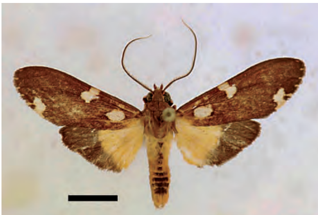
Figura 1. Coiffaitarctia imperatrix sp. nov. Macho. Vista dorsal. Escala 5 mm.

Ala anterior (dorsal): Marrón, con presencia de tres manchas blancas notorias, medianas: una casi al centro de la extensión del ala, que nace en el margen costal y con presencia de escasas escamas rojizas hacia el mismo margen costal, se extiende cruzando la Subcosta y alcanza la Radial, donde se desvía ligeramente hacia al margen externo, alcanzando el ángulo interno de la celda discal; una segunda cerca a la base del ala, entre la vena Cubital y la Anal; una tercera en el margen externo del ala, teniendo como ancho los extremos de la Cu_2 y algo más arriba de la Cu_1 ,