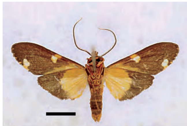
Figura 2. Coiffaitarctia imperatrix sp. nov. Macho. Vista ventral. Escala 5 mm.