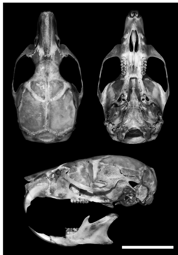
Figura 1. Vistas dorsal, ventral y lateral del cráneo, y vista lateral de la mandíbula, de Chilomys instans (MUSA 15427) de Perú. Escala= 10 mm.

Especímenes examinados (03).- MUSA 15425, 15427 y 15428, machos adultos, colectados en la localidad de La Granja, distrito Querocoto, provincia Chota, departamento Cajamarca (6°23'43.19"S, 79°10'1.40"W, 3140 m) el 18 de enero de 2014, por César E. Medina.