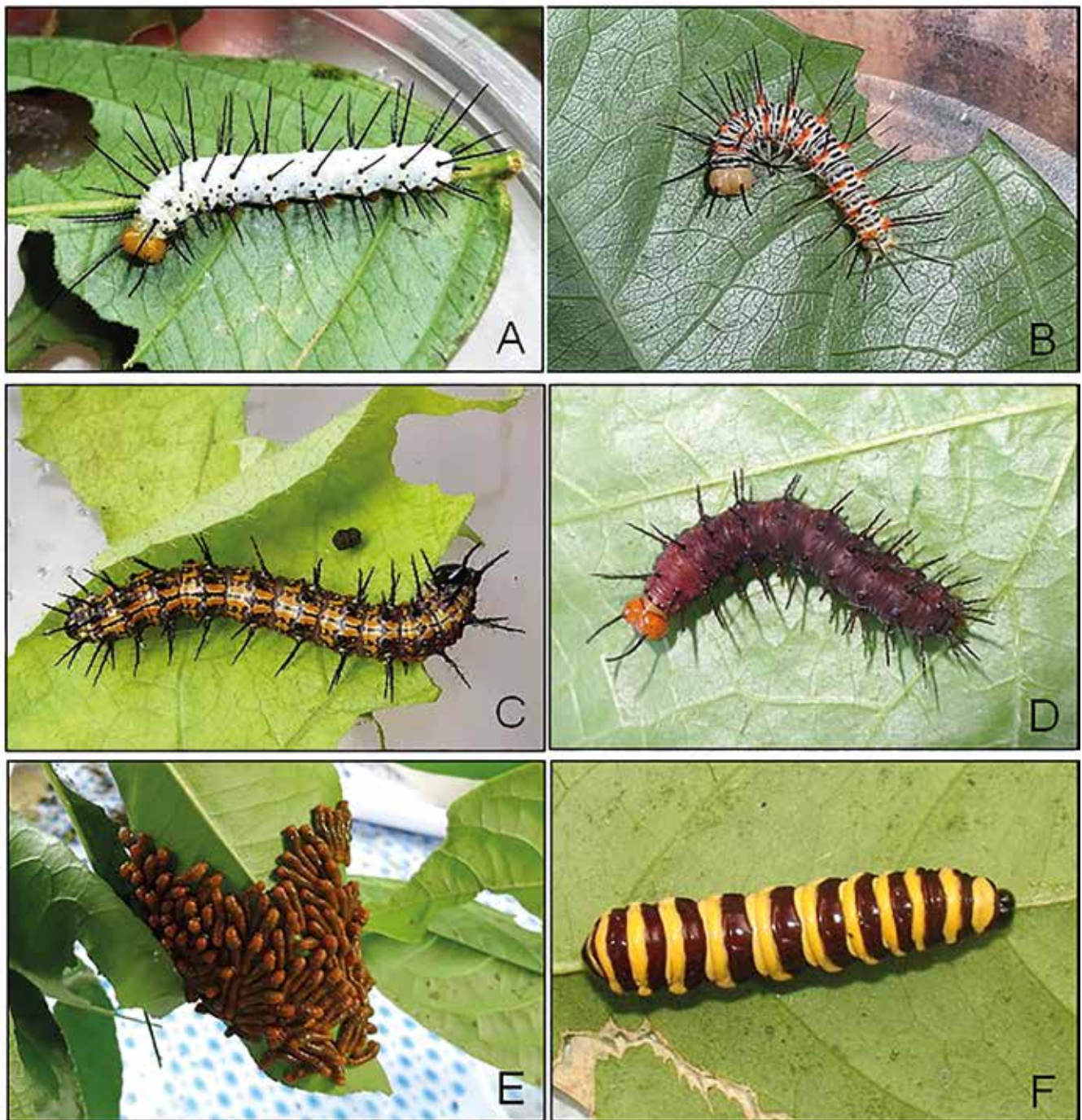
Apéndice 3. A) Larva de Heliconius numata sobre hojas de Passiflora edulis ; B) Larva Philaethria dido sobre hoja de P. edulis ; C) Larva de Dryas iulia alcionea sobre hoja de P. foetida ; D) Larva de Dryadula phaetusa sobre hoja de P. foetida ; E) Larva de Heraclides anchisiades sobre hoja de Citrus medica ; F) Larva de Methona confusa psamathe sobre hoja de Brunfelsia grandiflora .