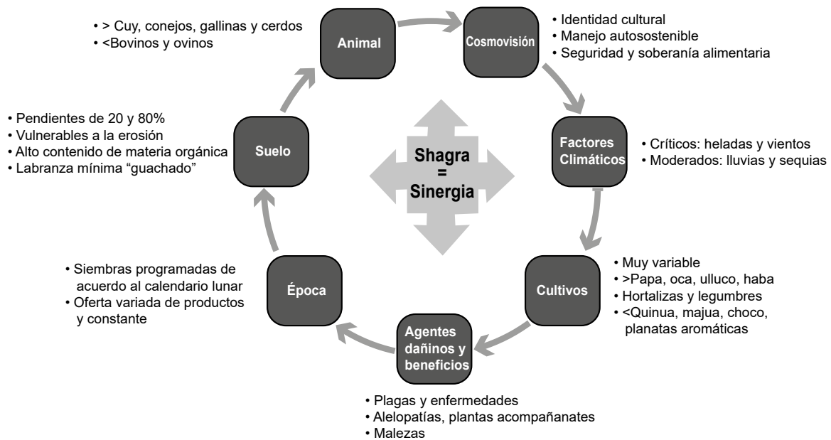
Figura 2. Componentes de la Shagra: * características, < menor participación de la especie, > mayor participación de la especie.

Adicionalmente se identificó que este tipo de producción se encuentra integrado en un 90% con al menos dos animales de granja quienes se benefician de los subproductos, entre los cuales se tiene en su orden de importancia, el cuy, el conejo, el cerdo, la gallina ponedora y en menor proporción los ovinos. Esta integración contribuye al suministro de macro y micronutrientes, proporciona excretas que se pueden usar como abono para los cultivos, energía de tiro y genera ingresos adicionales (Mottet et al. 2017). Según Hoshide et al. (2007) la reintegración de los sistemas agrícolas y pecuarios se ha reconsiderado como un paso clave hacia la agricultura sostenible.