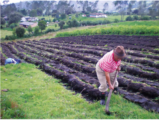
Figura 1. Labranza con azadón "Guachado"