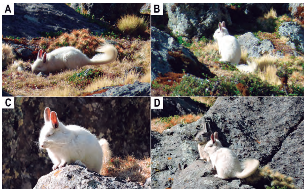
Figura 2. A, B registro del primer individuo albino; (A) individuo alimentándose de Huaracco ( Austrocylindropuntia floccosa ), (B) en su hábitat. C, D registro del segundo individuo; (C) tomando sol, (D) acompañado de otros individuos.

Dos pobladores locales informaron que individuos de coloración blanca han venido siendo avistados desde hace muchos años. El señor Ruperto Valenzuela comentó haber visto individuos blancos desde que era un niño (desde hace 35 años aproximadamente), recordando haber observado uno o dos individuos por año. Sin embargo, recalcó que en algunos años no observó individuos con esta coloración. El profesor Laureano Pelaez comentó que en un lapso aproximado de 7 años (1983 – 1990) logró observar en tres oportunidades individuos de vizcacha de coloración blanca.