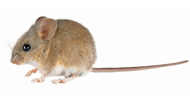
Figura 2. Phyllotis andium (hembra adulta) registrado en la parroquia de Susudel al sur de la provincia del Azuay.

La descripción de estos nidos muestra por primera vez la capacidad de Phyllotis andium para usar plantas introducidas como Pennisetum clandestinum en la construcción de nidos y refugios. Probablemente el uso de este pasto se deba a la estructura misma de la planta, que al ser una gramínea perenne de la familia Poaceae presenta hojas largas, delgadas y con superficie suave (Mears 1970), lo que es contrastante con las especies nativas del lugar (e. g. Acacia macracantha , Armatocereus cartwrightianus , Calliandra taxifolia o Furcraea andina ) que tienen adaptaciones a zonas secas como la presencia de espinas y hojas duras (Aguirre et al. 2013), por lo que el uso de P. clandestinum facilitaría la construcción del nido y brindaría mayor confort.