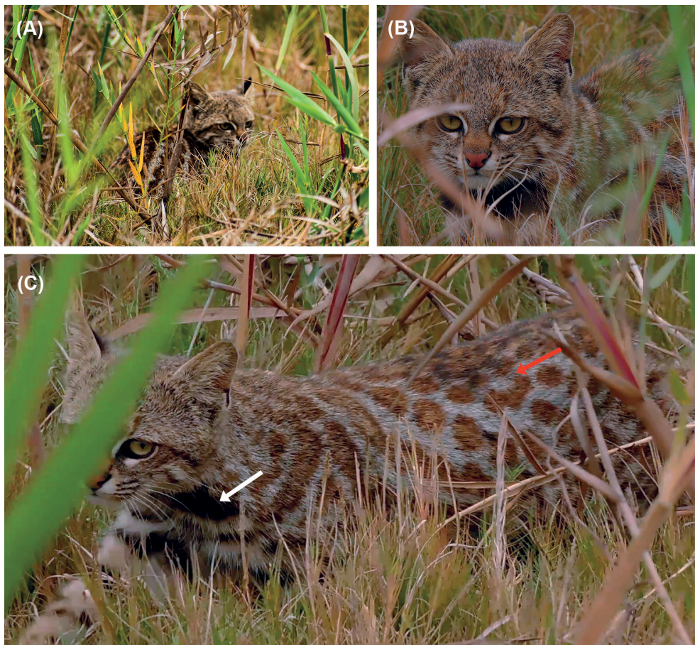
Figura 1. Diferentes vistas del espécimen de Leopardus garleppi avistado en los Humedales de Eten, Lambayeque, Perú, el 13 de octubre del 2019. (A) vista trasera y (B) vista frontal de Leopardus garleppi . (C). Vista lateral de Leopardus garleppi que evidencia la franja gular (flecha blanca) y las rosetas en la zona dorso lateral (flecha roja).

Desde el 2015 hasta la fecha L. garleppi han sido registrados en el Perú y nominado como L. colocolo , O. colocolo o L. pajeros en 12 localidades con 18 reportes (Tabla 1) (Fig. 2) (García-Olaechea et al. 2013, SERNANP 2015a, 2015b, 2019a, 2019b, Pino 2017, García-Olaechea & Hurtado 2018, Palomino & Ataucusi 2019, Ojeda 2019, Luque-Fernández 2020, García-Olaechea & Hurtado 2020), sumando así un total de 267 registros desde el último presentado por Hurtado et al. (2016).