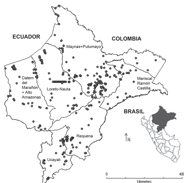
Figura 3. Registros (círculos grises) de anfibios en el departamento de Loreto. Se muestran juntas las provincias Datem del Marañón y Alto Amazonas, y Maynas y Putumayo.

En la Figura 3 se muestra la distribución de los registros de los anfibios en Loreto. Aunque todas las provincias de Loreto tienen reportes de anfibios, se observa que el área cerca de Iquitos, en la provincia de Maynas y un área central en la provincia de Loreto muestran mayor densidad de registros, relacionado a una mayor intensidad de muestreos. Por el contrario, en las provincias de Putumayo, Mariscal Ramón Castilla y Requena, las áreas cercanas a las fronteras con Colombia y Brasil presentan pocos registros.