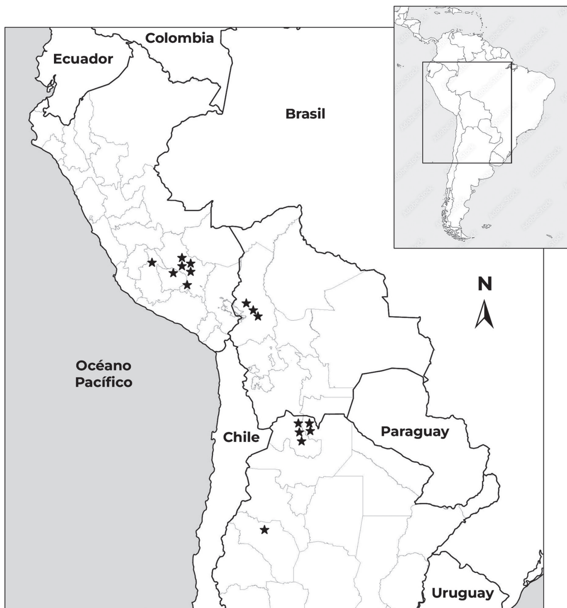
Figura 2. Distribución geográfica actual de Tagetes imbricata (estrellas), incluyendo los registros del presente trabajo.

C. Vargas 22785 (CUZ 34622); Distrito Luque, Pikillacta, Wacarpay, Bosque Seco Interandino, 3030–3120 m, 13°37'54"S, 71°44'9"W, 4 febrero 2004, W. Galiano & E. Suclli 5639 (CUZ 41842, MO). Prov. Paruro, Dist. Yaurisque, suroeste de Cusco, en el camino de Cusco a Paruro, 3300 m, 7–8 marzo 1987, P. Nuñez 7373 (CUZ 34658, MO 030052, USM 123463). Prov. Paucartambo, antes del puente Paucartambo, 3250 m, 26 marzo 1978, C. Vargas 23111 (CUZ 34631). Prov. Quispicanchis, Huambutío, 3150 m, 15 mayo 1976, C. Vargas 22793 (CUZ 34632). Prov. Urubamba, Huayllabamba, entre la quebrada Huayocari, Lagunas de Yanacocha y Kellococha, 2900–3860 m, 13°21'15"S, 72°03'55"W, 12 febrero 1989, A. Tupayachi 920 (CUZ, MO 027596); Chicón, 2900 m, 12 febrero 1971, C. Vargas 22231 (CUZ 34630); camino de Urubamba a Calca, sobre el km. 61, Hacienda Killes-Hyayocari, ca. 2 km al SE de Yuca y 12 km al NW de Calca, ca. 3000 m, 29 diciembre 1962, H. H. Iltis et al. 894 (US 01808757, USM 58286); Ollantaytambo, 3000 m, 7 mayo 1915, O. F. Cook & G. B. Gilbert 576 (US 01808756).