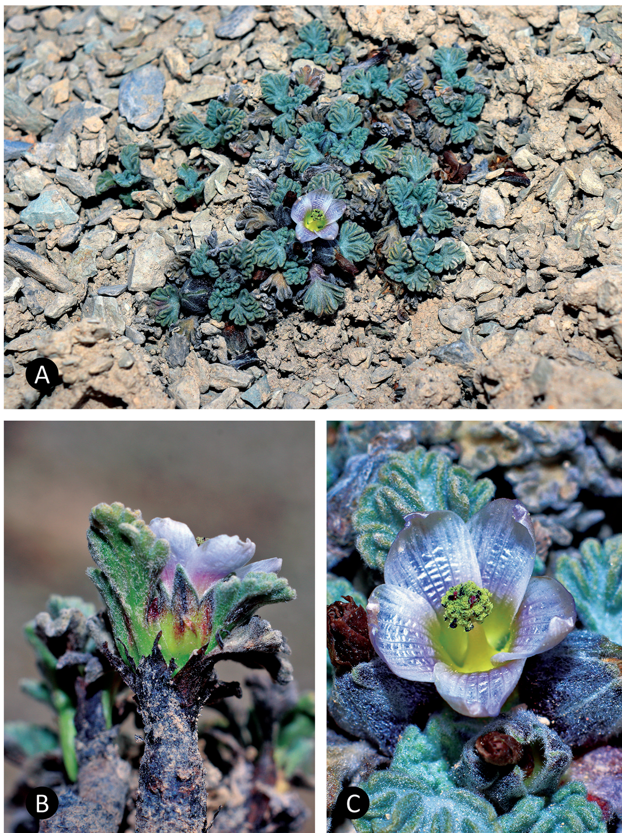
Figura 2. Nototriche chancoae sp. nov. A. Hábito. B. Vista lateral de una rama mostrando el lado externo del cáliz con nervaduras púrpuras. C. Vista superior de la flor. de la colecta de A. Cano et al. 22799 (USM), Abra Antajirca, Huaral, Lima, 4797–4850 m de altitud.